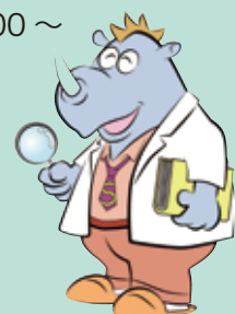
サイエンス倶楽部